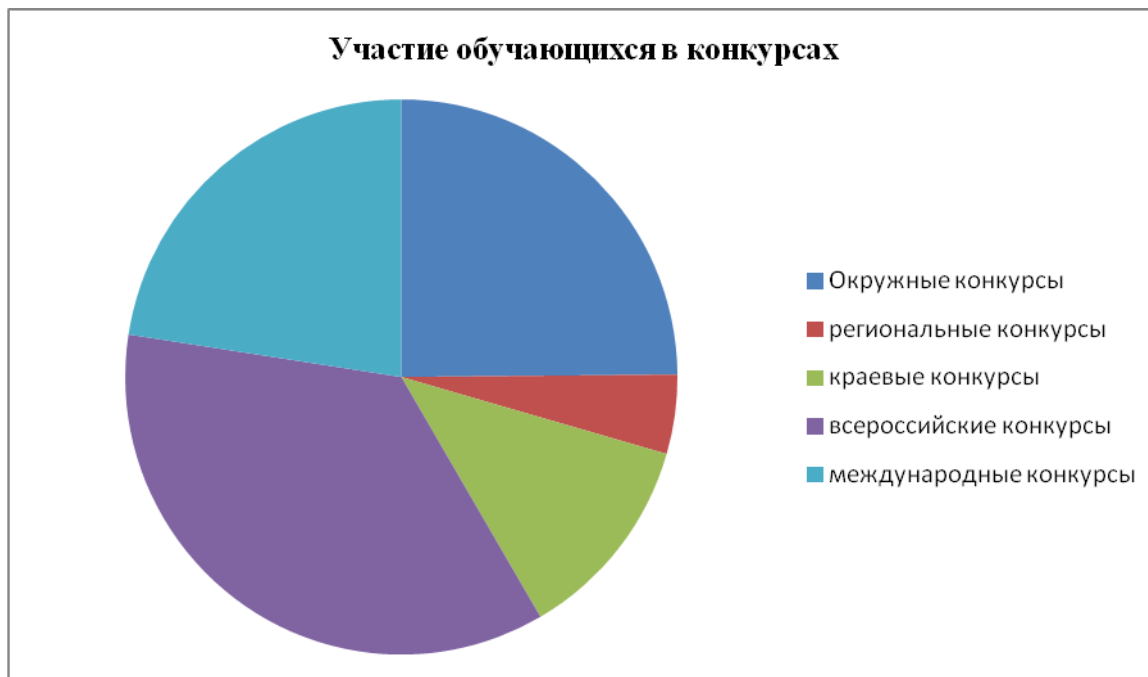
Сравнительная таблица по итогам участия в конкурсах обучающихся МБУ ДО ДТ за два учебных года